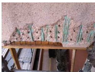
Traitement de la carbonatation